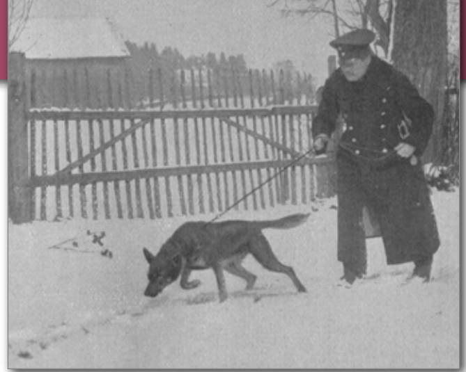
Verbrecher machen auch im Winter keine Pause. Fährtenarbeit an kurzer Leine.