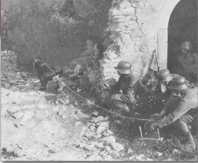
Der Kabelhund brachte das Kabel zum Flicker der zerschossenen Fernsprechleitungen.