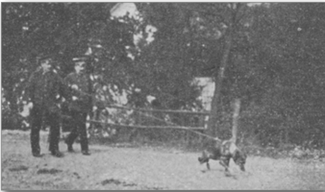
Die Deutsche Schäferhündin «Hilde» bei der Ausarbeitung einer fremden Spur.

Most erklärte im Jahr 1913, dass es ein Kriminalhund in dem bisher geglaubten Sinne nicht gäbe, kein Hund wäre imstande, eine menschliche Spur nach einigen Stunden noch zu halten, noch viel weniger aber die Spuren verschiedener Menschen richtig und dauernd zu unterscheiden. Er behauptete auch, dass der Hund im Kriminaldienst die grössten Gefahren für die öffentliche Sicherheit mit sich brächte.