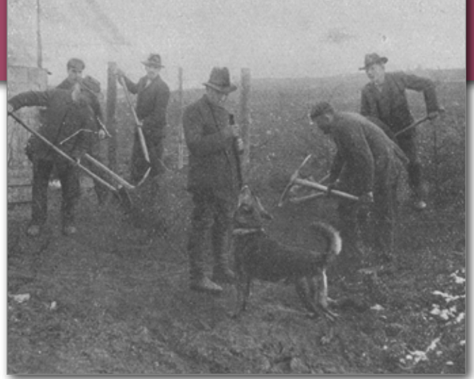
Polizeihund «Tell von der Höhe» findet den Verbrecher aus der Menschengruppe und stellt ihn.