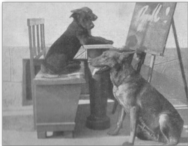
Zum Schmunzeln: Zukunftshundeschule, Unterstufe. Bild entstand im Jahr 1921

Egal in welchem Buch man stöbert oder aus welcher Zeit es stammt, immer wieder können wir lesen, dass unser Deutscher Schäferhund es war, der die Polizeihundebewegung machte und sie auch noch