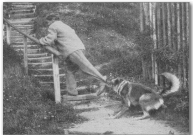
Der Hund vereitelt die Flucht des aufgespürten Täters und hält ihn am Hosenbein fest.