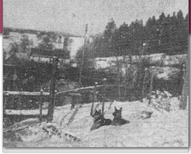
Einsatz Deutscher Schäferhunde während des Weltkrieges im Grenzschutzgebiet an der Schweizer Grenze.

heute trägt. Rittmeister von Stephanitz erkannte schon früh, dass es sich beim Deutschen Schäferhund um eine ganz besondere Rasse handelt, die sich vorzüglich für den Dienst eignet und bestätigte dies im Jahre 1905 mit folgenden Worten: