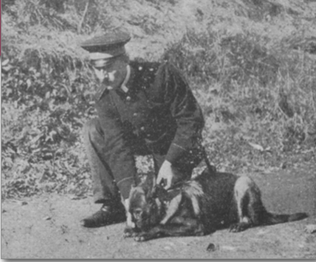
Die Deutsche Schäferhündin «Lady» wird vom Polizeisergant auf die Spur angesetzt.

te Grünheide. Zur gleichen Zeit wurde auch der Polizeikommissar Konrad Most, der durch den «SV» empfohlen wurde, am 1. Februar 1912 nach Grünheide als Leiter dieser Anstalt berufen.