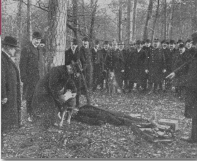
Der Hund riecht an einem Taschentuch, das der Mörder verloren hat, damit er dessen Witterung aufnehmen kann.