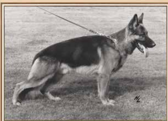
Ulf von Basilisk: