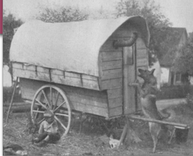
Der Hund ist am Ende der Spur fündig geworden und zeigt den Fund an.